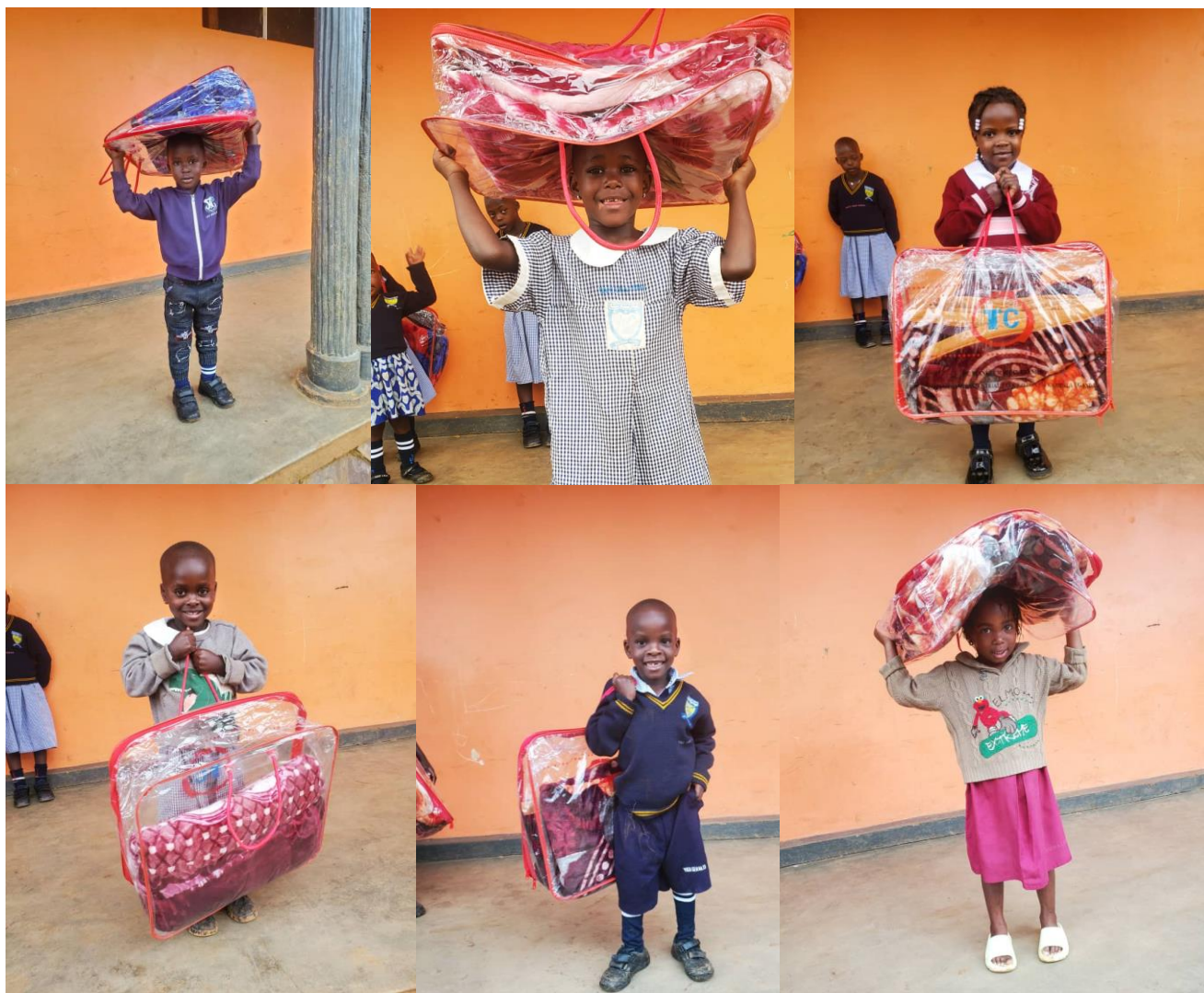
Daphines Kindergarten an der Bishop Ddungu-Schule in Kyamaganda: Freude hat viele Gesichter.